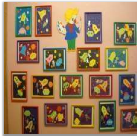
Конструктивный центр «Учимся конструировать»